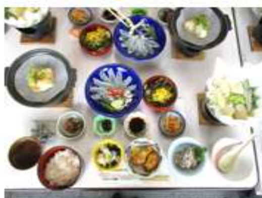
下関の三大味覚膳