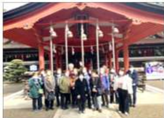
長門国一宮 住吉神社