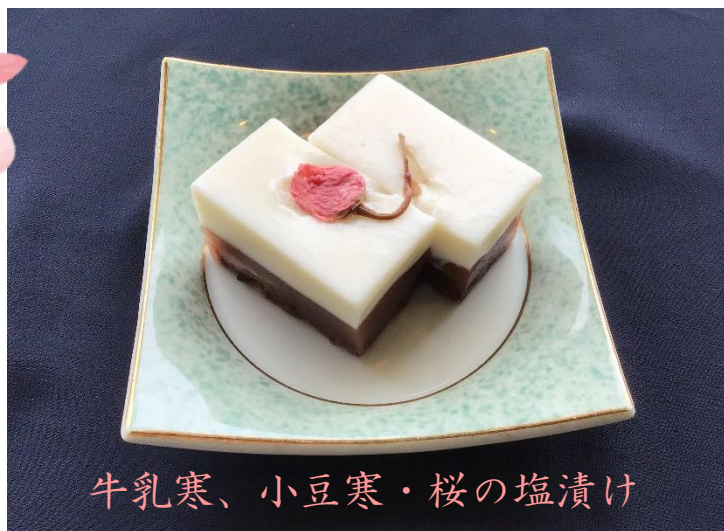
牛乳寒、小豆寒・桜の塩漬け